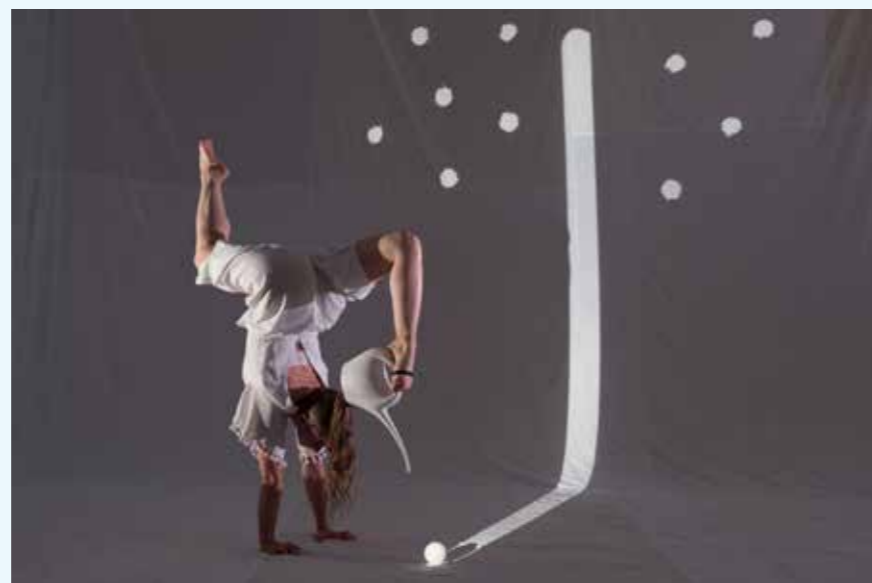
Company Portmanteau: Piste, piste, piste.