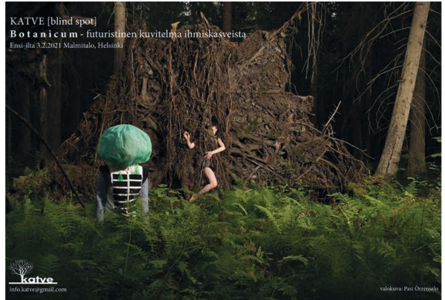
KATVE [blind spot] Botanicum - futuristinen kuvitelma ihmiskasveista Ensi-ilta 3.2.2021 Malmitalo, Helsinki