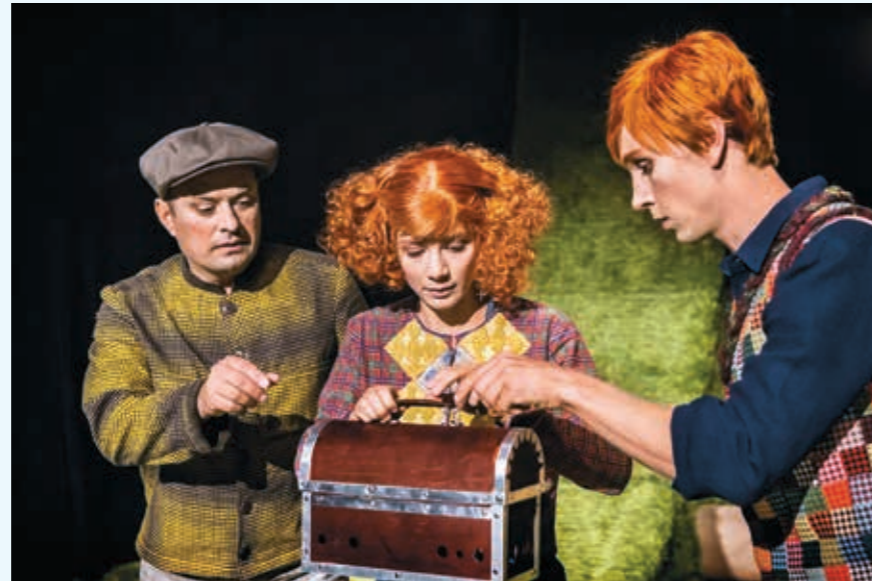
Claire Parsons co.: Gräs.