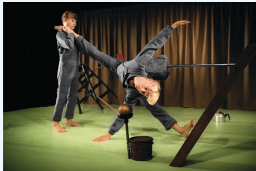
Kompani Giraff: Tvärslöjd.