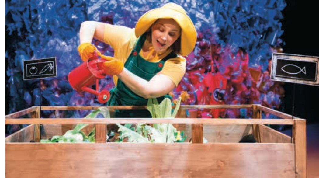
Kuva Hulivili ja oikkuileva ilmasto esityksestä.