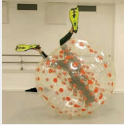
Agata -teoksen harjoitukset joulukuussa.

Lisätietoja KATVE [blind spot] -nykytanssiryhmän toiminnasta: https://katveblindspot.kuvat.fi