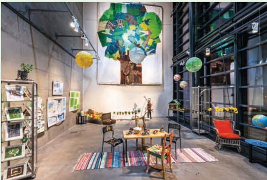
Koti Luonnossa -näyttely Vuotalon galleriassa.

lisen yhteistyön valmistelun PerformanceSirkuksen ja kahden eurooppalaisen teatterin kanssa. Haemme rahoitusta Euroopan unionin Luova Eurooppa-ohjelmasta, joka käynnistyy vuonna 2021. Hankkeen teemana on yleisötyö ja liikkuvuuden edistäminen. Tavoitteenamme on tavoitella uusia entistä laajempia yleisöjä, sekä syventää suhdetta yleisöön huomioiden mm. kohderyhmäajattelun, saavutettavuuden, erityistarpeet, interaktiivisen teatterin muotojen kehittämisen sekä pitkäkestoisen prosessin tarpeet ja vaatimukset.