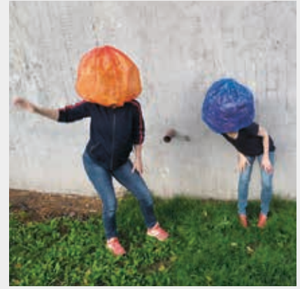
Botanicum -teos.