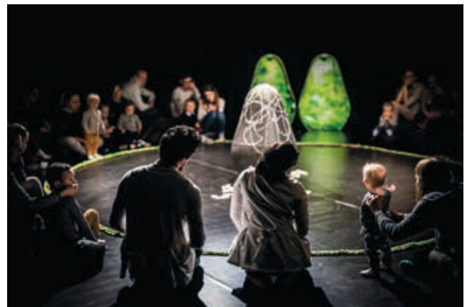
Tekijä: Children's Art Centre in Poznań. Esitys: Blisko.