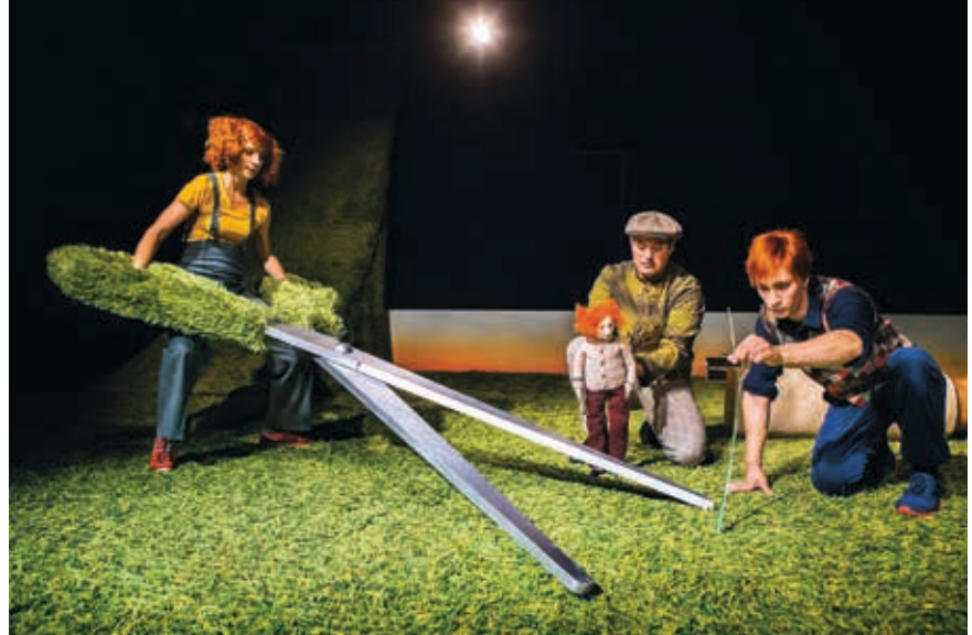
Tekijä: Claire Parsson Co. Esitys: Grass.

Assitej etsii jäsenistään vapaaehtoisia avustajia Bravo! -festivaalin kansainvälisille esitysryhmille. Ole yhteydessä festivaalituottajaan: riikka.siirala@assitejfi.org