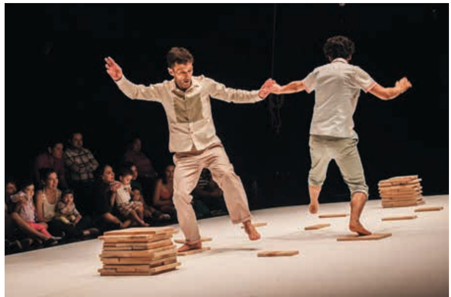
Tekijä: Teatro Al Vacio. Esitys: Pulsar.