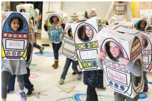
Tekijä: Line Art. Esitys: Ready Steady Lift Off.